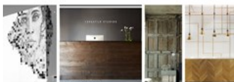
RECEPTION / ROUGH WOOD LUXURY